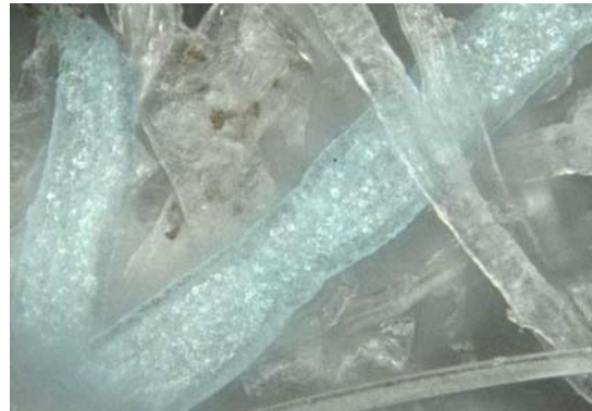
セルガイア配合梅炭抄織糸の実態顕微鏡写真 ※青く見える繊維がセルガイア