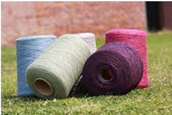
セルガイアを配合した梅炭抄織糸

世界的にも注目される「和」の技術を結集して開発されたクールジャパン商品の、高付加価値化にも貢献するセルガイアに今後ご期待ください。