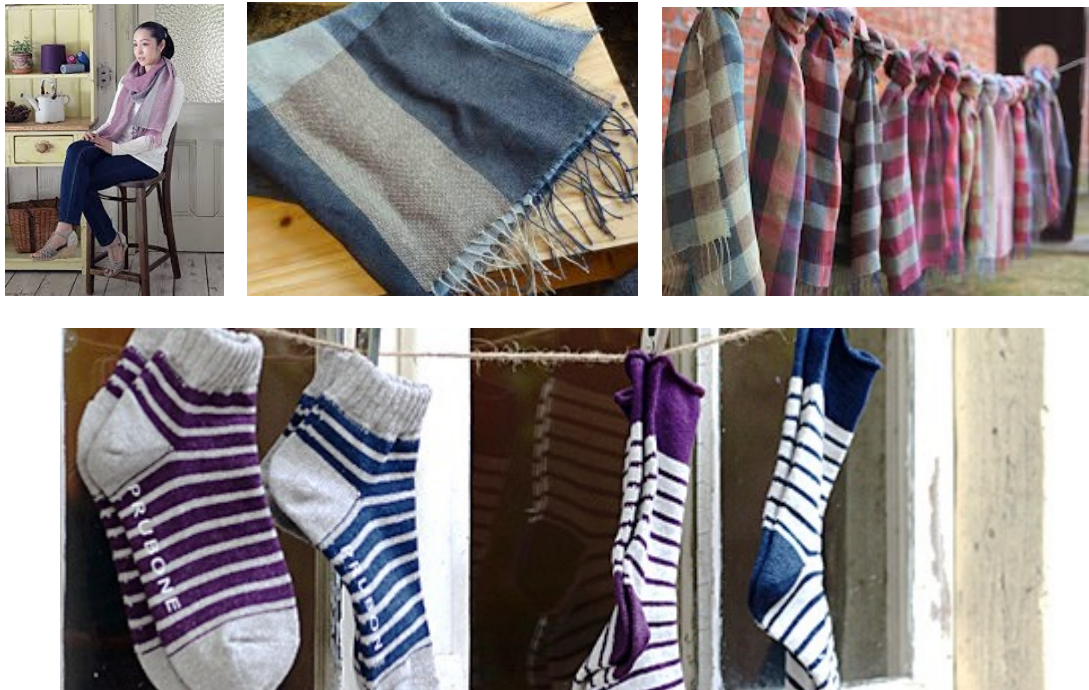
セルガイア配合梅炭抄織糸を用いた抗菌服飾雑貨製品例

http://www.sunrising-h.com/prubone.html (株)サンライジング社 HP)